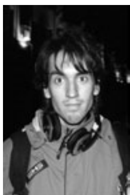
Иван Городнов Фотограф