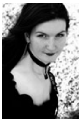
Наталья Успенская Фотограф